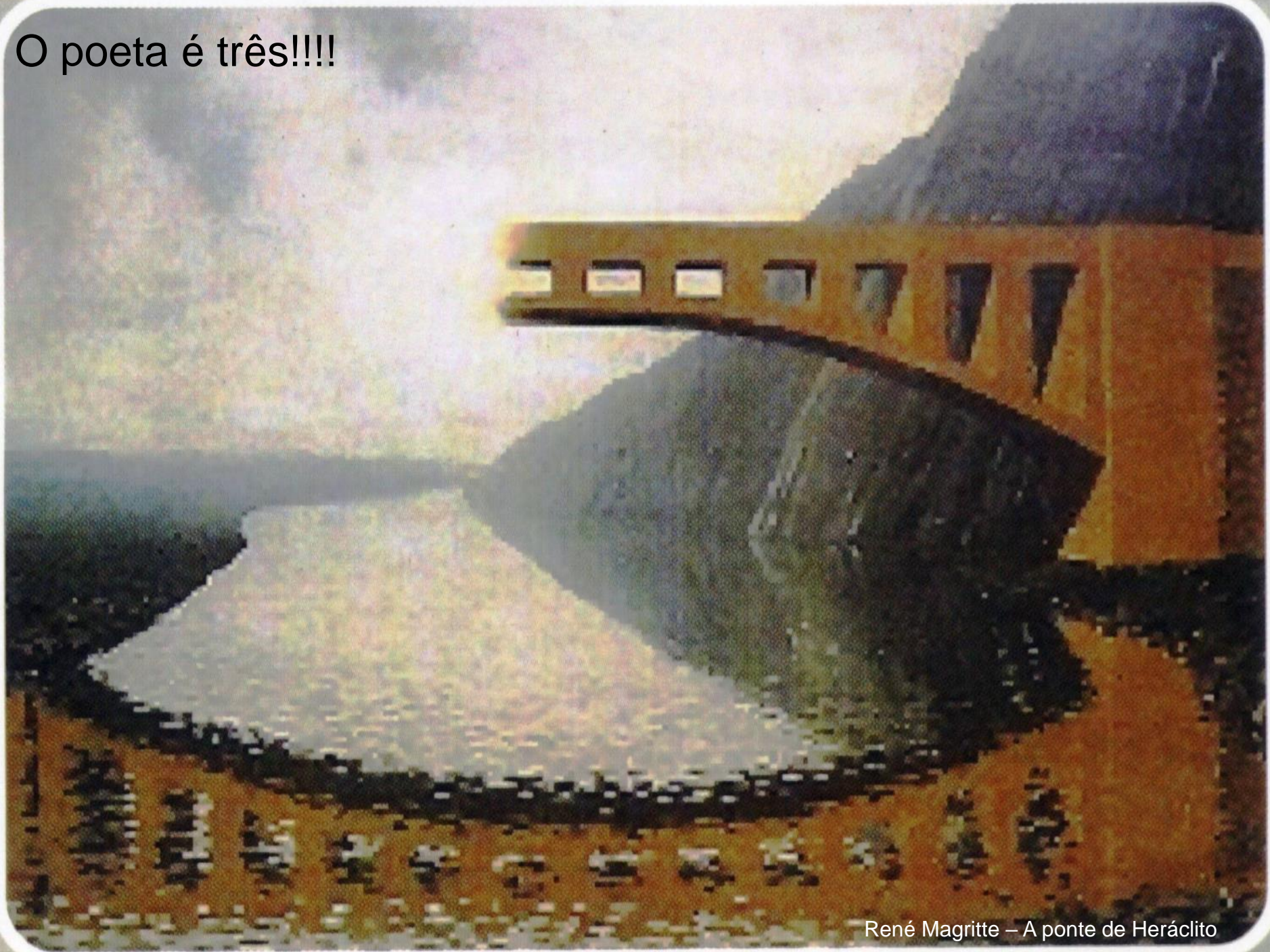
René Magritte – A ponte de Heráclito